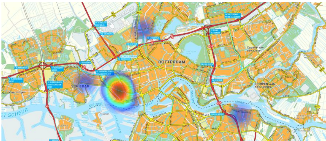
Figuur 3: Fragment uit de standaardrapportage van de groepsscan

Het is mogelijk dat een jeugdgroep in meerdere gemeenten actief is of contacten onderhoudt of qua samenstelling overlapt met andere jeugdgroepen (uit andere gemeenten). De procesregisseur neemt dan contact op met de andere gemeente(). Daardoor wordt bestuurlijke prioritering over de aanpak van jeugdgroepen intergemeentelijk mogelijk. Om te beoordelen met welke andere gemeenten contact gezocht zal worden, kan gebruik gemaakt worden van het grafisch beeld van de locaties/gemeenten waar de jeugdgroep actief is, zoals opgenomen in de groepsscan (zie de onderstaande figuur).