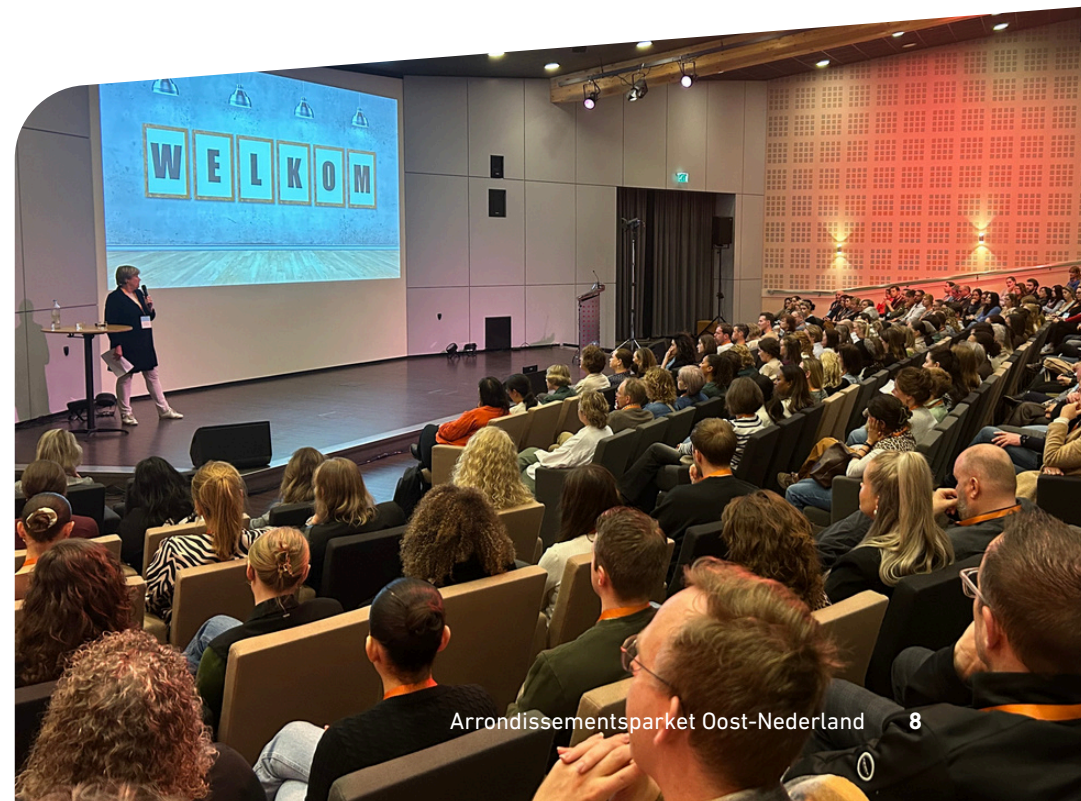
Opening Vakdagen 2025 in Burgers Zoo.

en cursussen. Ontwikkeling van medewerkers en het bevorderen van duurzame inzetbaarheid dragen bij aan het voorkomen van uitval. Door inzet van verzuimexperts, bedrijfsarts en bedrijfsmaatschappelijk werker en het vergroten van kennis over verlof in relatie tot mantelzorgtaken, wordt gewerkt aan versterking van de werk-privébalans.