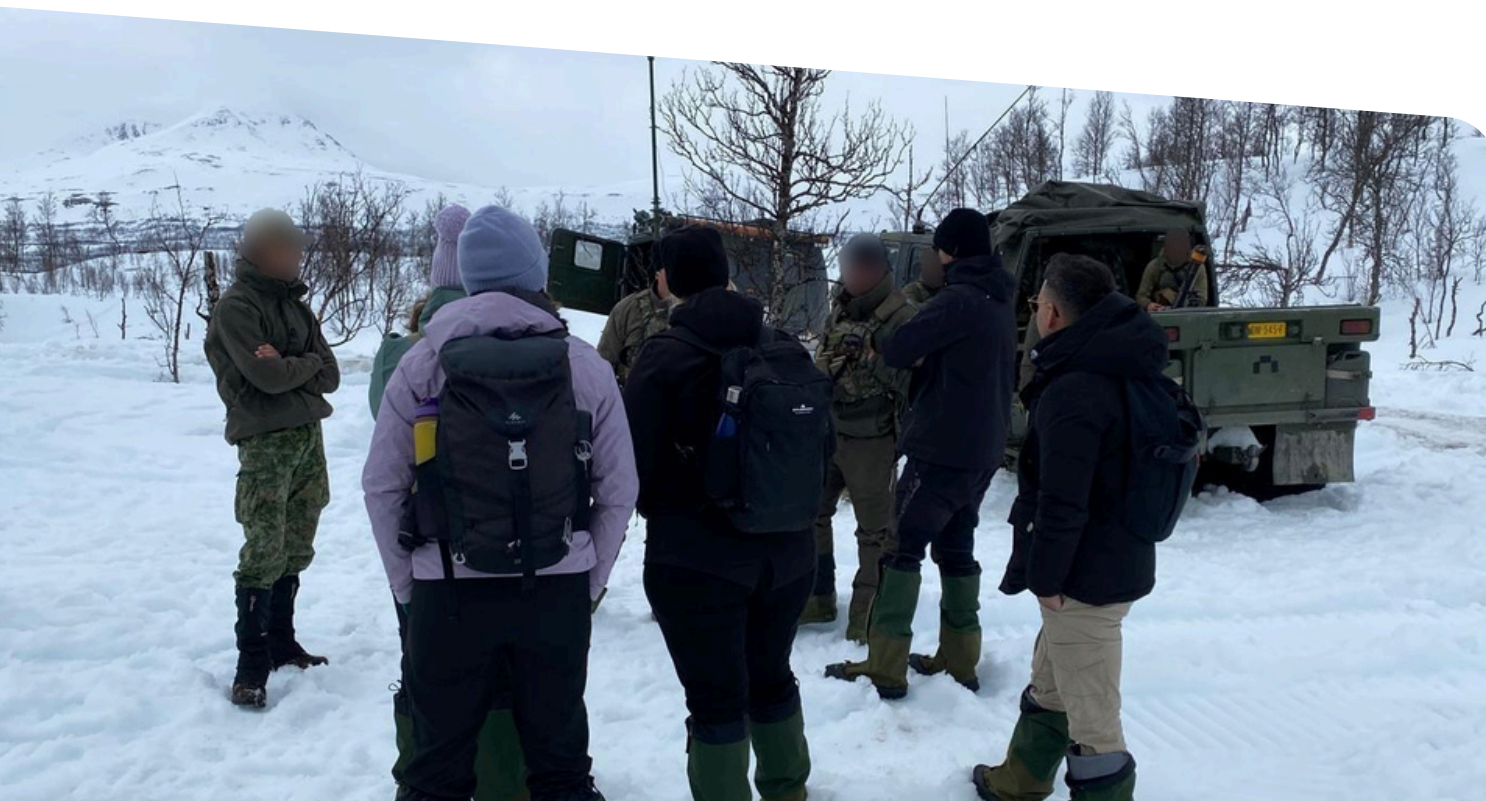
Werkbezoek team Militaire Zaken Bardufoss, Noorwegen.