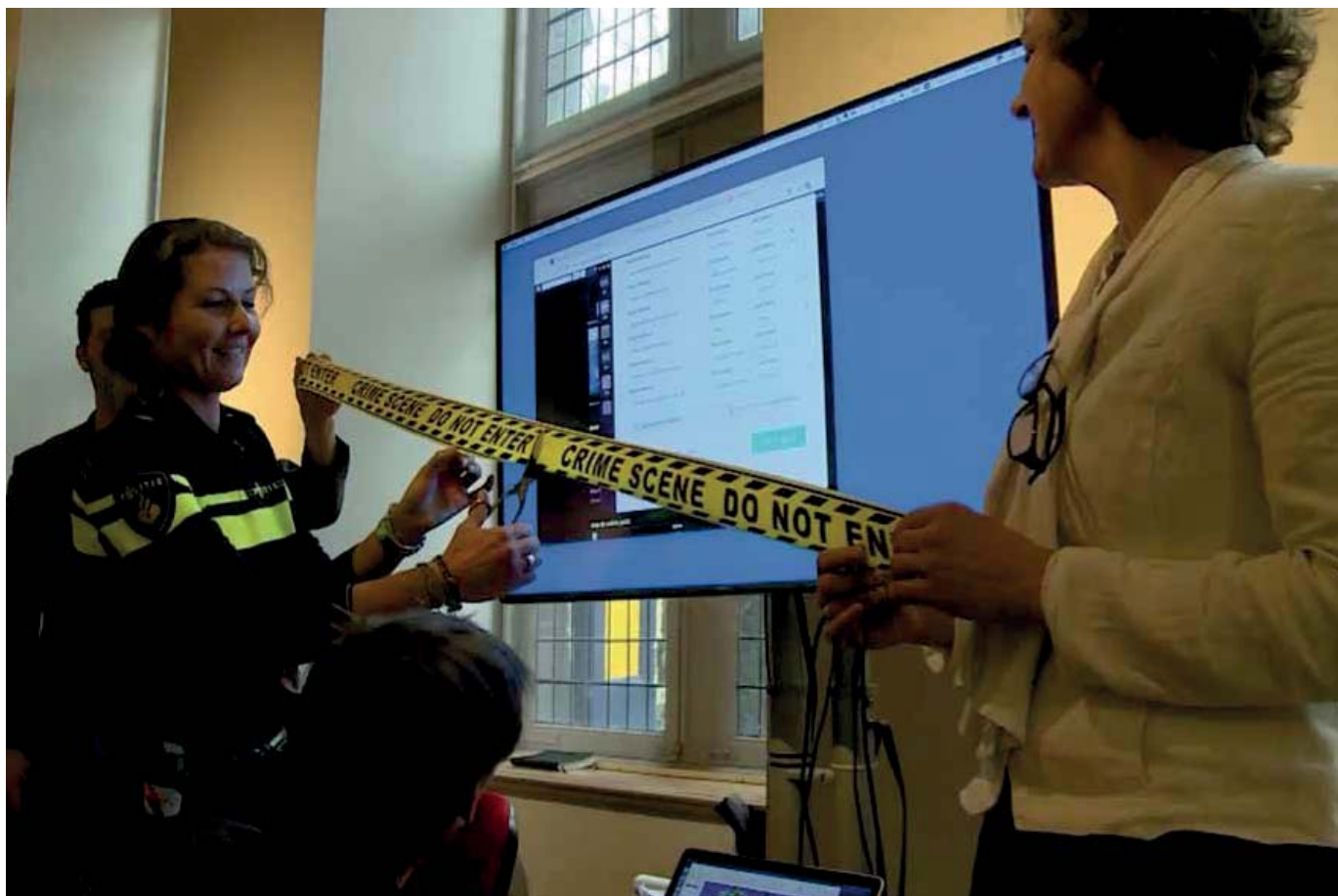
Start TCF-pilot in Leeuwarden.

Onmisbaar voor de TCF-pilot zijn natuurlijk de casussen: vragen en opdrachten die zijn ontleend aan de politiepraktijk. Politie mensen uit verschillende teams hebben casussen aangeleverd. In totaal zijn 26 casussen geüpload in de online community: van een casus waarin jongeren is gevraagd om ongeregelde heden te signaleren tijdens The Passion in Leeuwarden tot casuïstiek waarin is gevraagd om bij te dragen aan cold cases . In de online community is een mappenstructuur aangebracht. Iedere casus kreeg een eigen map, bijvoorbeeld #casusovervaller. Als een casus geen nieuwe informatie meer opleverde, werd deze afgesloten en daarna gearchiveerd.