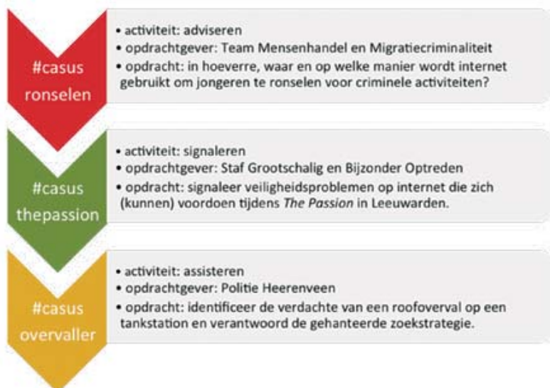
Figuur 1: Drie voorbeeldcasussen.

Dit zijn enkele concrete opbrengsten van de TCF-pilot, maar voor een gedegen evaluatie van de pilot is meer nodig. Dit 'meer' is vertaald in een draagvlakmeting onder politiemensen van de Eenheid Noord-Nederland, interviews met jongeren en politiemensen binnen de TCF-pilot, interviews met juridisch experts en een statistische en inhoudelijke analyse van de online activiteiten.